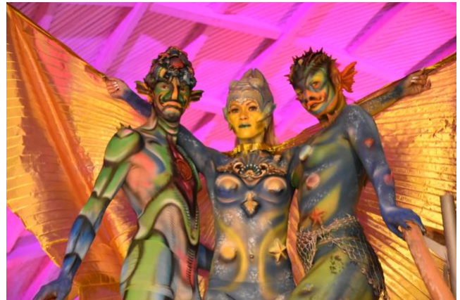
Die phantastischen Wasserwesen in der Toskana Therme.