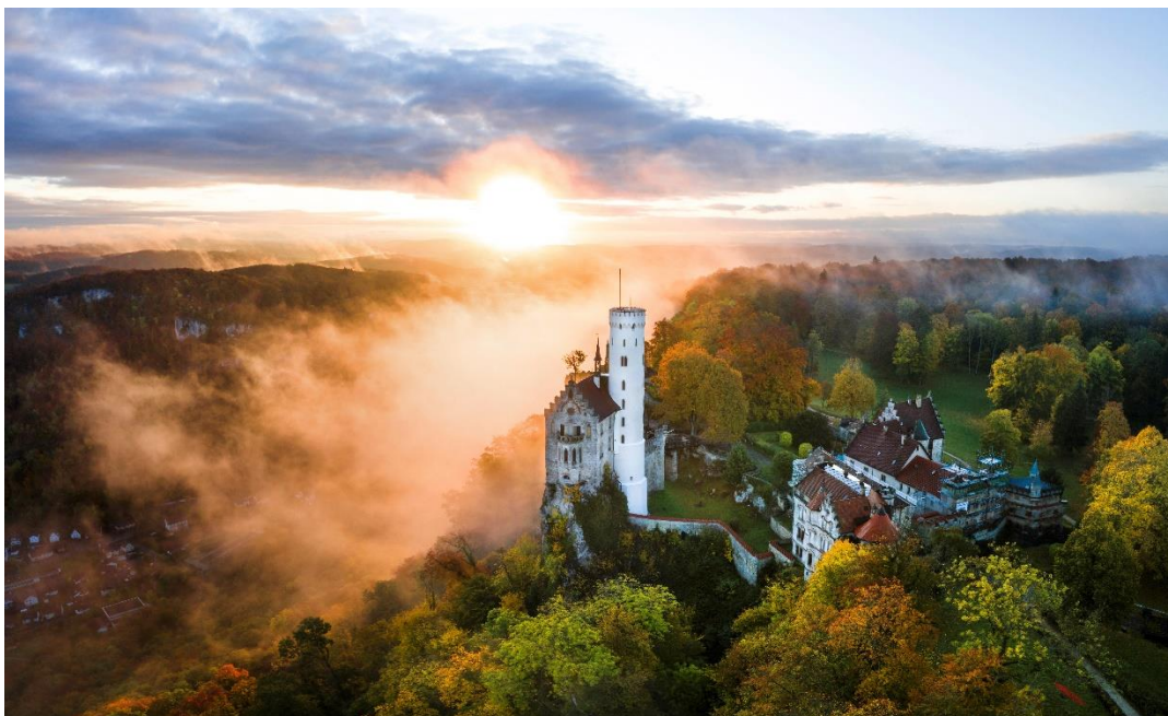
Luftaufnahme Schloss Lichtenstein, © Mythos Schwäbische Alb / Dominik Lars Breitbarth

Mythos Schwäbische Alb Tourismgemeinschaft Bismarckstraße 21 72574 Bad Urach Tel. (0 71 25) 15060 - 60 Fax (0 71 25) 15060 - 40 www.mythos-alb.de